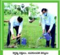
కర్షణ కార్యక్రమం, ఉద్యానవనం నిర్మాణం