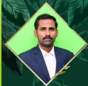
పువ్వుల ఆనంద్ ప్రజా సంబంధాల అధికారి